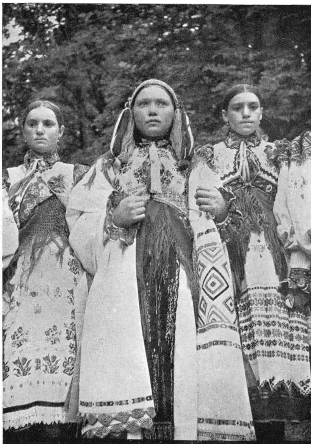
Obr. 5. Mladucha s partou a prehodeným prestieradlom, Závadka. — Foto K. Plicka. — Po r. 1920