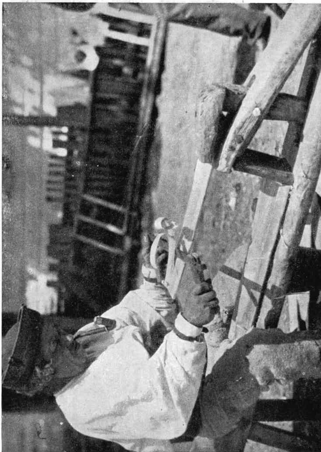
Obr. 2. Mužský letný pracovný odev, Šumiac. — Foto K. Plicka. — Po r. 1920