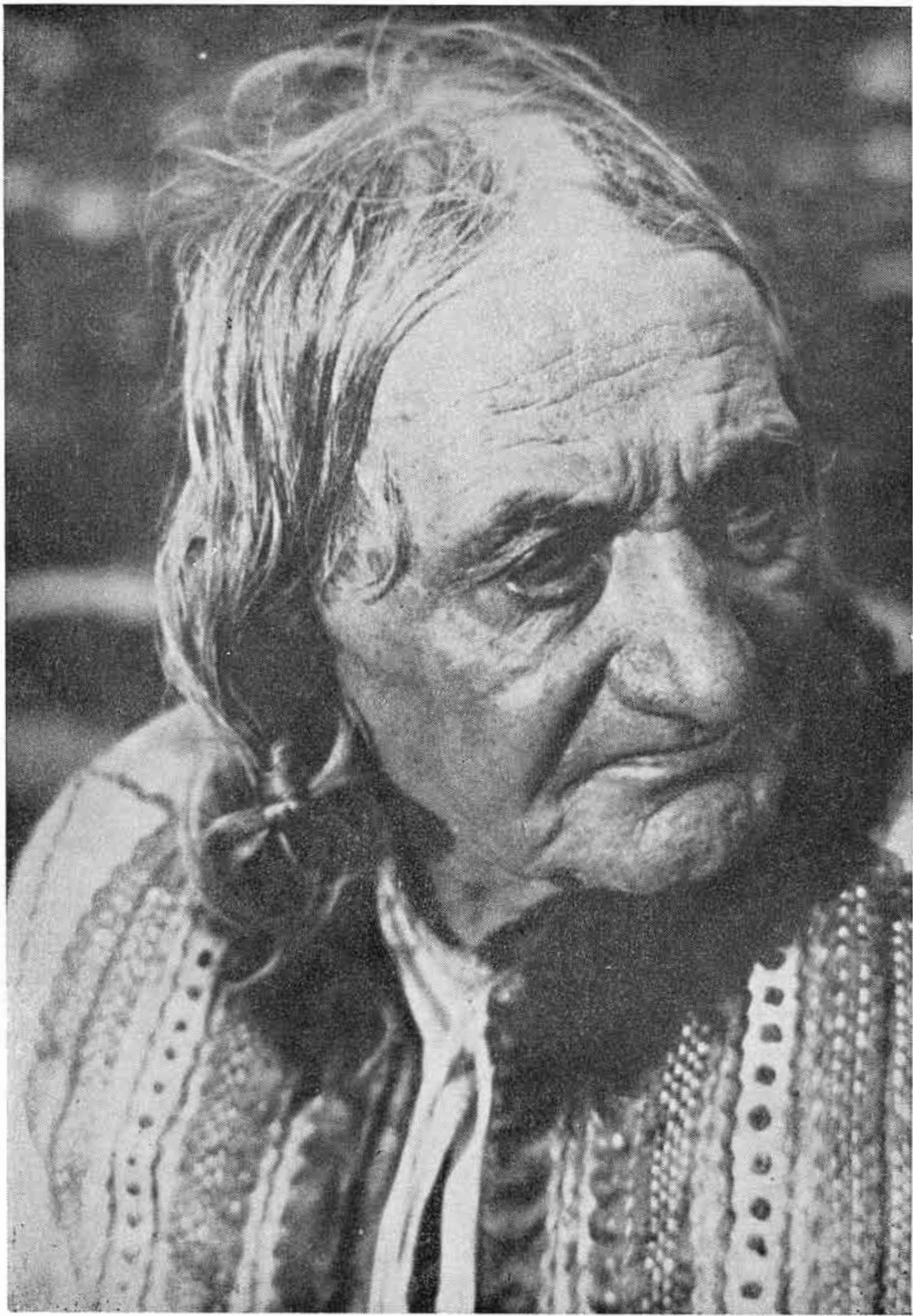
Obr. 1. Účes starých chlapov na hrčki . — Foto K. Plicka. — Po r. 1920