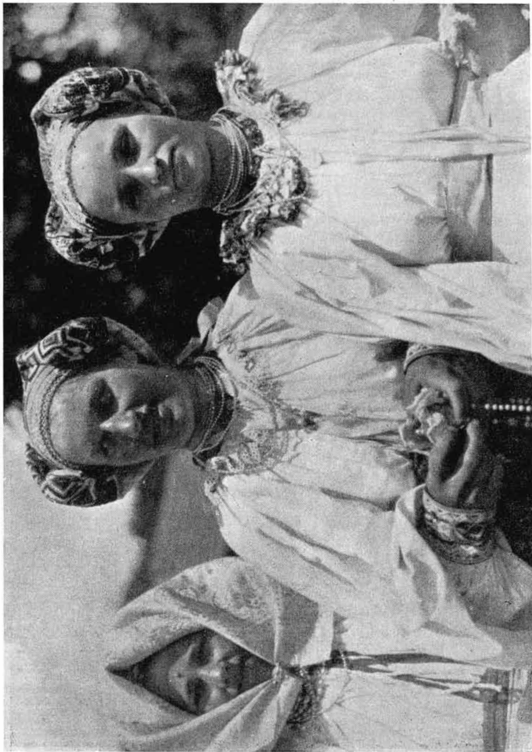
Obr. 6. Helpianske nevesty v sviatočnom odeve. — Po r. 1920