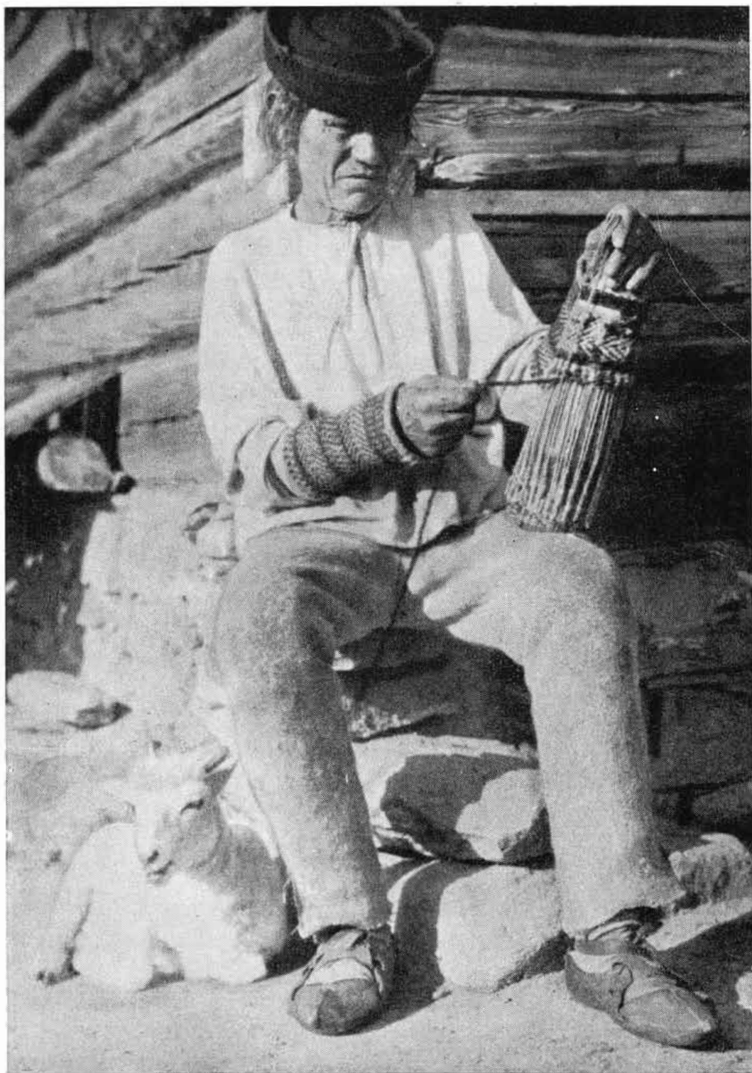
Obr. 3. Tkanie zápästkov na klátiku, Šumiac. — Po r. 1920