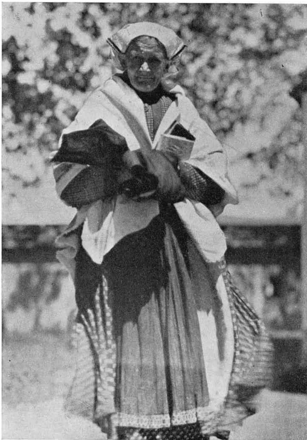
Obr. 4. Stará žena v smútku, sviatočný odev, Závadka. — Foto K. Plicka. — Po r. 1920