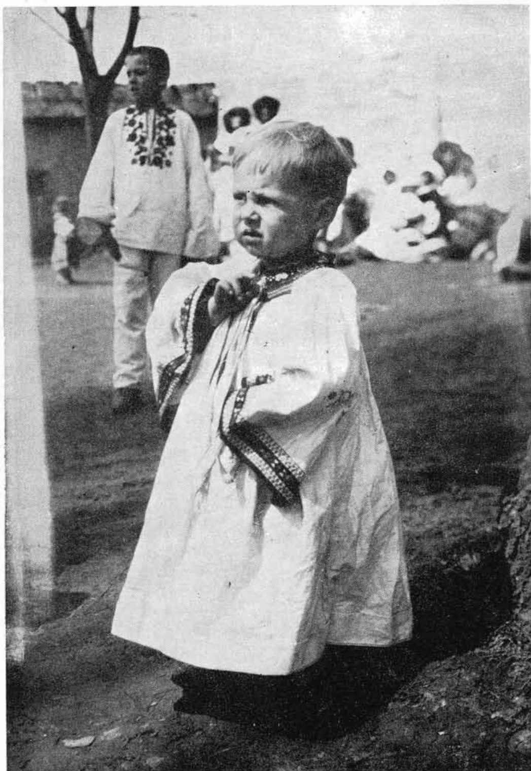
Obr. 9. Detský odev kikla , Závadka. — Foto K. Plicka. — Po r. 1920