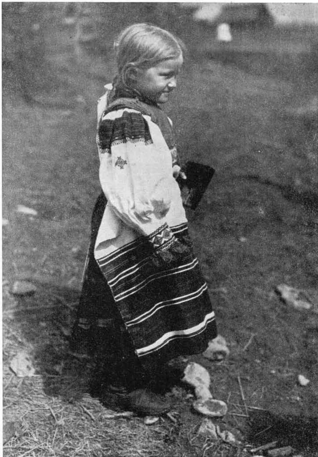
Obr. 8. Dievčenský odev sviatočný, Závadka. — Po r. 1920